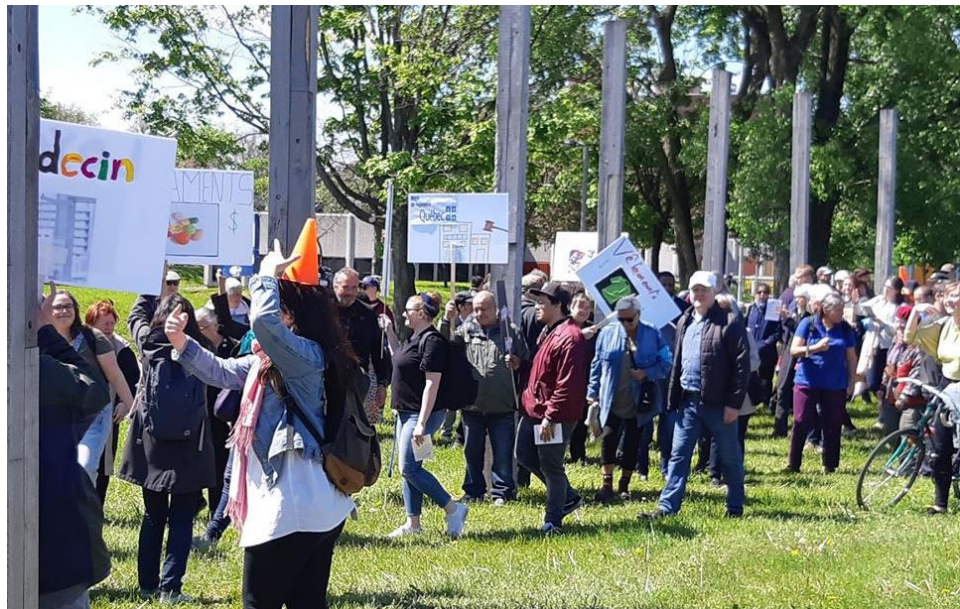
Photo : Une centaine de personnes manifestent en faveur de la tarification sociale.

L'avis a également été acheminé aux responsables du transport de tous les partis politiques ainsi qu'aux députés des circonscriptions des organismes l'ayant appuyé.