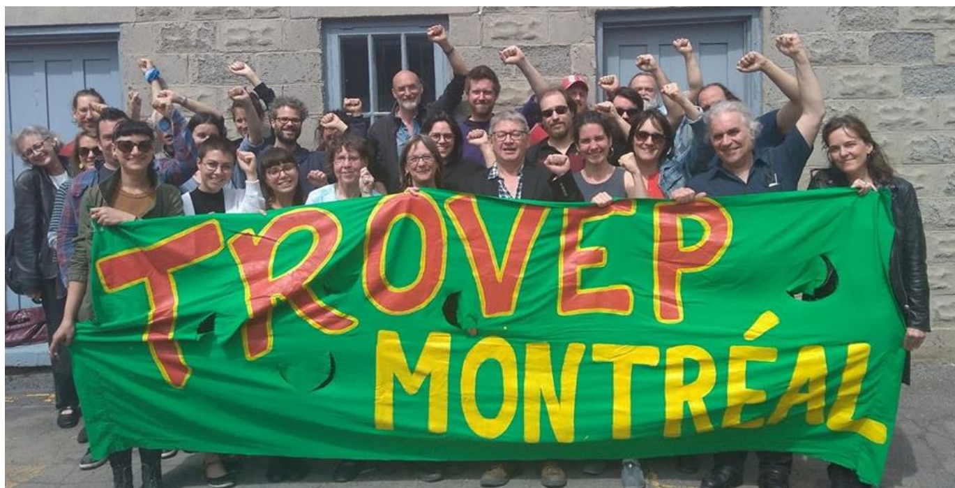
Photo : Les membres de la TROVEP de Montréal réunis à l'extérieur du Centre St-Pierre derrière la bannière de la TROVEP lors de l'AGA 2019.

La forte participation des groupes membres et de leurs participantes et participants témoignent de leur soutien au réseau d'action de la TROVEP et nous saluons leur solidarité envers les luttes pour la justice sociale.