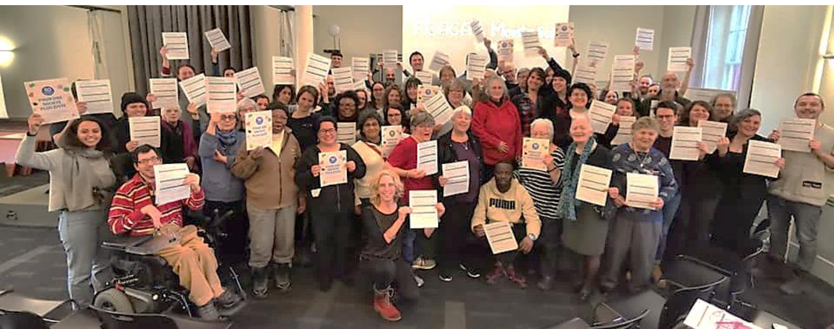
Photo : Les participantes et participants à l'assemblée du FRACA Montréal posent ensemble en appui aux 10 milliards de solutions de la Coalition Main Rouge.

La Coalition Main rouge a profité de l'occasion pour lancer la mise à jour du document 10 milliards $ de solutions pour une société plus juste! qui présente 19 mesures pour lutter contre les inégalités sociales et fiscales et pour assurer une transition écologique juste.