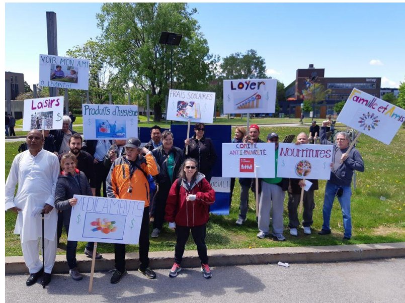
Photo : Plusieurs membres du groupe d'alphabétisation du CÉDA après le rassemblement du 4 juin.

En plus de maintenir nos alliances avec le TRAAQ, cette année a été l'occasion d'en développer davantage à l'extérieur de Montréal avec la Coalition montréalaise pour la tarification sociale en transport et le Mouvement d'éducation populaire autonome de Lanaudière (MEPAL).