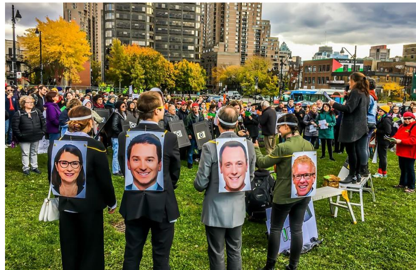
Photo : Les ministres incarnés par des membres du coco du FRACA s'adressent à la foule lors de la manifestation du 23 octobre.