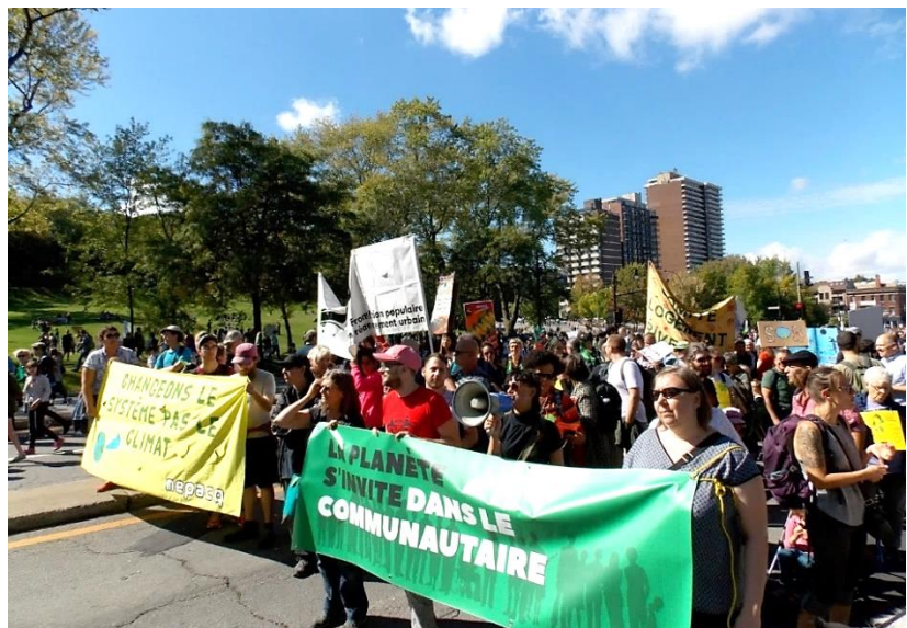
Photo : Un contingent communautaire marche sur l'Avenue du Parc derrière une bannière sur laquelle on peut lire "La Planète s'invite dans le communautaire".

Cette fois encore la TROVEP a convié les organismes à se rassembler derrière la bannière La planète s'invite dans le communautaire . Des efforts ont été déployés pour obtenir les informations nécessaires à la participation des personnes en situation de handicap . Malheureusement, pour des raisons de sécurité, nous a-t-on dit, ces renseignements ont été très difficiles à avoir et, au final, le service de police de la ville de Montréal a fermé le centre-ville à la circulation routière, interrompant ainsi les services de transport adapté. La TROVEP a fait part de ces ratages aux organisateurs.