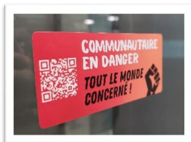
Autocollant de l'action du 4 février

Les groupes en DCD sont sous-financés depuis des années et n'ont jamais obtenu l'indexation annuelle de leur financement. Résultat, nous nous appauvrissons à chaque année alors que les besoins augmentent. Et comme si étouffer la DCD en l'appauvrissant n'allait pas assez vite pour le gouvernement de la CAQ, son projet de loi 7 (aujourd'hui adopté) menace directement notre existence et l'autonomie de toute l'action communautaire autonome (ACA). La TROVEP a donc appelé les groupes en DCD mais également nos alliés et les organismes d'ACA à répondre présents et solidaires et à se mettre en action pour dénoncer ces attaques sans précédent !