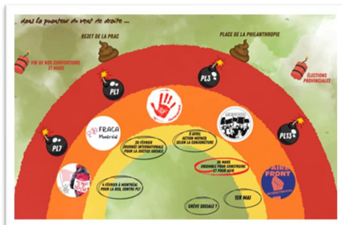
Graphique de la conjoncture