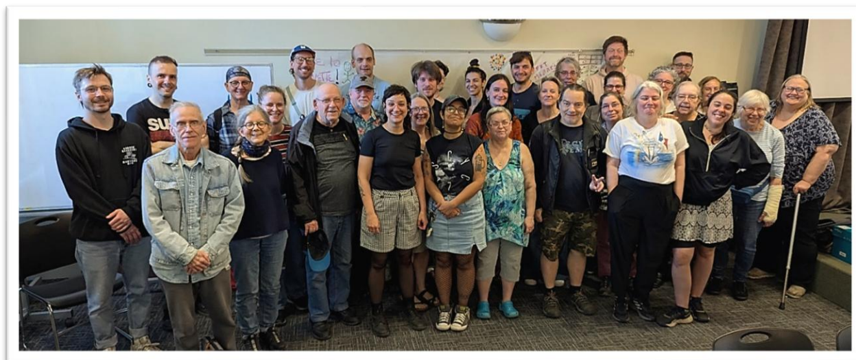
Des personnes déléguées des groupes membres de la TROVEP réunies lors de l'AGA du 27 mai 2025