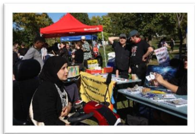
Des membres et citoyen-es profitent de la foire le 2 octobre 2025

À pied, à vélo, en fauteuil, en bus ou en métro, pouvoir se déplacer dans la ville, c'est un droit! Avec les élections municipales de l'automne, le comité mobilité de la TROVEP a voulu développer ses alliances pour défendre une vision juste, écologique, inclusive et accessible du droit à la mobilité. Le comité a donc organisé une foire populaire sur le thème du droit à la mobilité le 2 octobre au parc Ahuntsic . 19 organismes de différents horizons étaient présents pour tenir des kiosques sur les