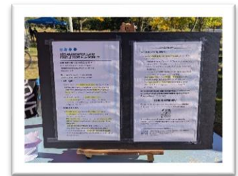
Déclaration populaire pour le droit à la mobilité