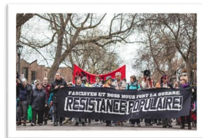
Manifestation du 1er mai 2025