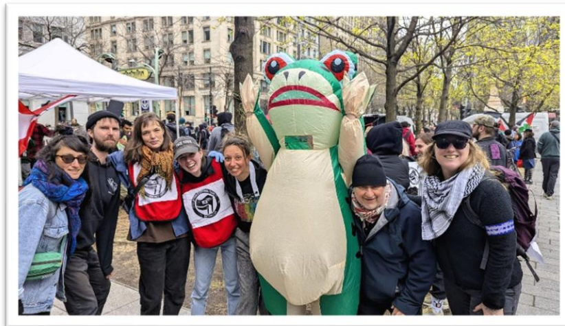
Des membres du coco du FRACA lors de la Fête solidaire des résistances populaires le 1er mai 2026