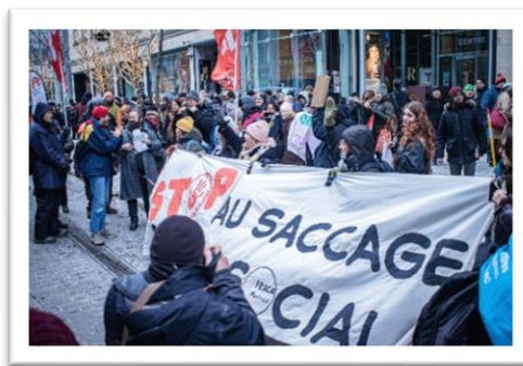
Drop de bannières dans le centre Eaton pour lancer l'action le 20 février 2026