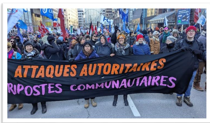
Contingent communautaire à la manifestation du 29 novembre

Face aux attaques du gouvernement caquiste contre nos droits et nos acquis sociaux, et parce que la montée de la droite et les reculs sociaux exigent une réponse forte et solidaire, les centrales syndicales ont appelé à une grande manifestation à Montréal le 29 novembre. L'objectif : dire non aux compressions budgétaires, au virage à droite du gouvernement et aux initiatives antisyndicales. Puisque le milieu communautaire est aussi attaqué, le Mouvement d'éducation populaire et d'action communautaire du Québec (MÉPACQ) a appelé à un contingent communautaire dont les revendications étaient POUR un financement à la mission globale suffisant! POUR l'autonomie des groupes communautaires! POUR le filet social! POUR la démocratie! 153 organisations communautaires ont signé l'appui au contingent et c'est 50 000 personnes des milieux communautaires, syndicaux, environnementaux, féministes, etc. et de partout au Québec qui ont pris la rue le 29 novembre!