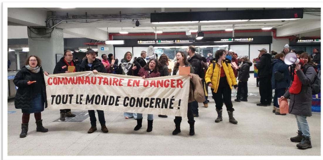
Un des groupes occupant le métro Berri-UQAM le 4 février

communautaire et France-Élaine Duranceau, responsable de l'Administration gouvernementale et de l'Efficacité de l'État et Présidente du Conseil du trésor. Définitivement, nous nous sommes fait voir et entendre!