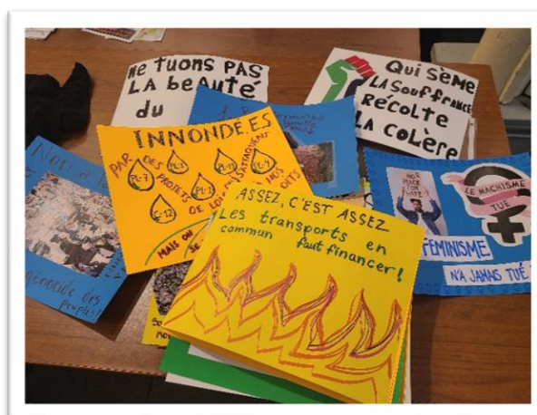
Des messages pour l'action du 9 avril réalisés en atelier