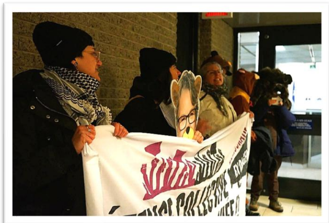
Action des membres du MÉPACQ contre PL7 le 12 mars

Dans le cadre d'une assemblée générale du Mouvement d'éducation populaire et d'action communautaire du Québec (MÉPACQ) et en vue du prochain budget, avec les 10 autres tables membres nous avons fait entendre notre colère face à notre sous-financement chronique et aux attaques gouvernementales à notre programme de subvention.