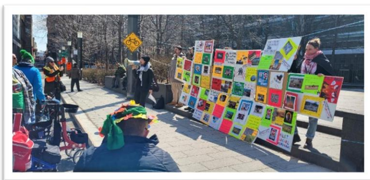
Le "mur" fait par les membres et alliés, érigé face au Palais des congrès le 9 avril 2026

La TROVEP a profité de l'assemblée de mobilisation « Attaques autoritaires, riposte populaire » du 26 mars pour organiser avec les personnes présentes, notre action en réponse à l'appel du Mouvement d'éducation populaire et d'action communautaire du Québec (MÉPACQ), en proposant une journée d'actions et d'éducation populaire autonome pour la justice sociale et climatique. Le thème « Inégalités et climat déréglé, c'est assez ! Le gouvernement des riches nous mène dans le mur ! » nous a inspiré une manif-Action devant le Palais des congrès pour la venue du congrès du parti libéral du Canada auquel participait le premier ministre Mark Carney. Une centaine de personnes se sont rassemblées afin de bloquer la rue et ériger un mur symbolique dont les briques portaient des représentations et des messages sur les enjeux de justice sociale et climatique qui illustrent comment on va dans le mur et à cause de qui.