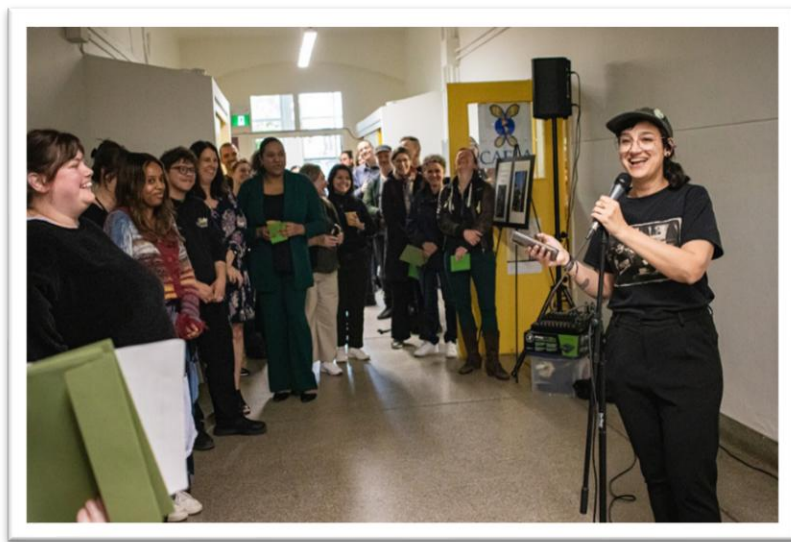
Prise de parole lors de l'inauguration du CSCPP le 22 mai 2025

La TROVEP était également sur le comité « inauguration » qui s'est rencontré à 5 reprises pour préparer l'événement qui a eu lieu le 22 mai 2025.