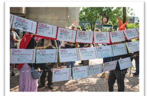
Corde à linge réalisée lors du rassemblement Déjà trop cher du 15 juin 2025

Organisé par le comité mobilité de la TROVEP et le Mouvement pour un transport public abordable (MTPA), une cinquantaine de personnes étaient réunies en après-midi au métro Lionel-Groulx pour dénoncer la cherté et la hausse des tarifs ainsi que pour revendiquer un meilleur financement du transport en commun. Ce sont les personnes usagères, et particulièrement les personnes à faible revenu qui paient le prix du sous-financement du transport collectif parce que les tarifs grimpent année après année. Le transport en commun est un service public qui devrait être financé à la hauteur des besoins!