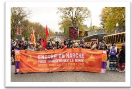
Marche mondiale des femmes à Québec le 18 octobre 2025